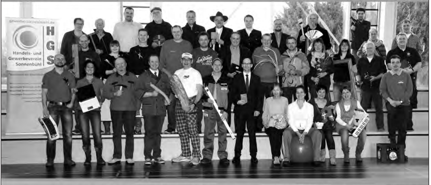
Am 23.+24.04.16 findet die zweite Gewerbemesse des Handels- und Gewerbeverein Sonnenbühl e.V. in und um die Sonnenbühler Sporthalle in Sonnenbühl-Genkingen statt. 31 Aussteller aus den unterschiedlichsten Branchen präsentieren sich, ihre Firmenphilosophie und Ihre individuellen Leistungen. Es gibt vielfältige Angebote an Speisen und Getränken. Für die Kinderunterhaltung ist ebenfalls bestens gesorgt.